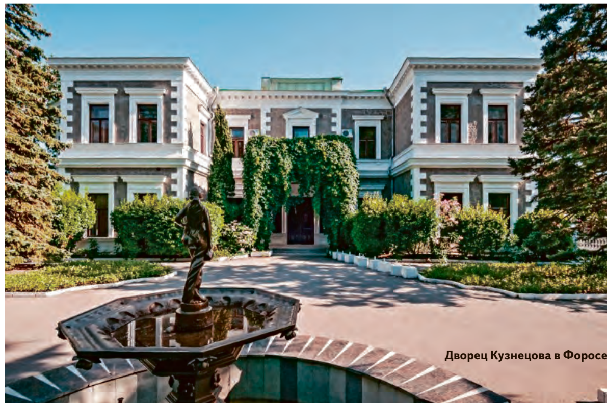
Дворец Кузнецова в Форосе